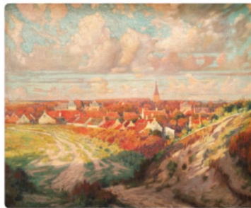
8. Jozef Posenaer Het dorp in de duinen / Das Dorf in den Dünen, Domburg 1917, olieverf op doek / Öl auf Leinwand, 80 x 95 cm collectie / Sammlung Fam. Courboin